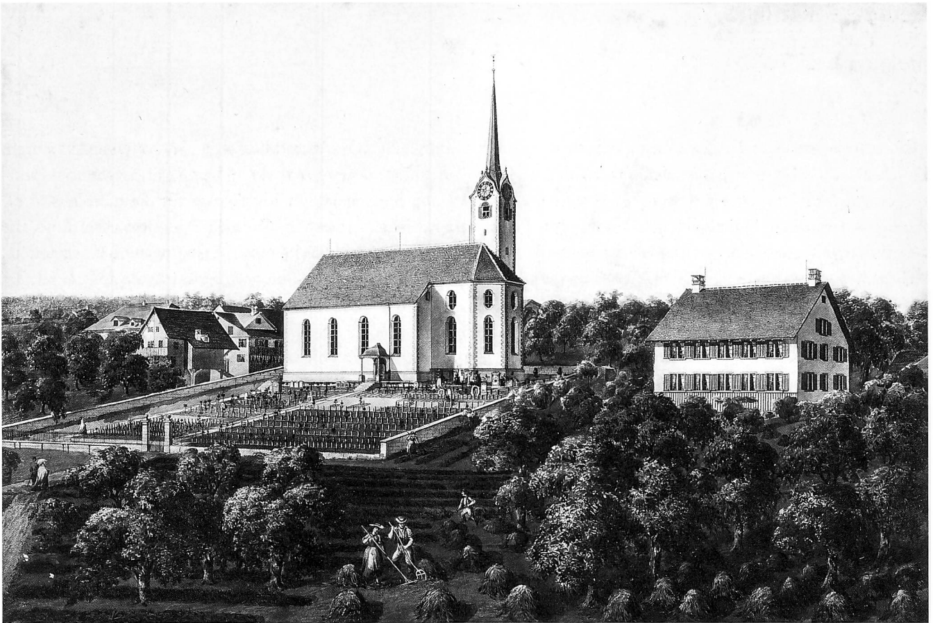
Die Kirche und das 1759/60 erbaute Pfarrhaus in Hombrechtikon auf einer 1867 entstandenen Ansicht von Adolf Honegger. Das Innere von der Empore aus, Aufnahme 2002.