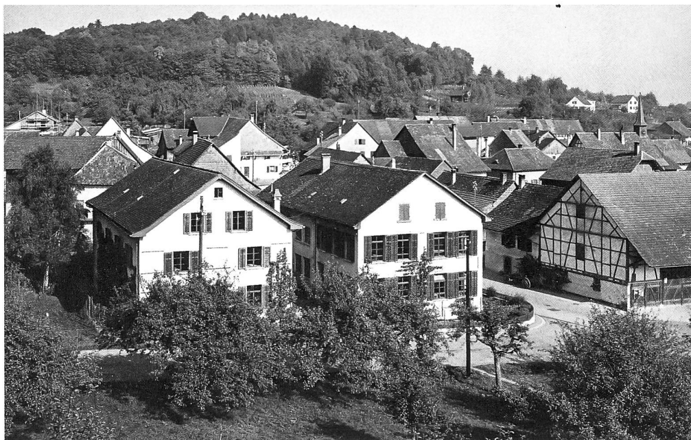
Die Arbeiterinnen an den Hutnähmaschinen der Firma Ritz in der Zwischenkriegszeit. Der relativ unscheinbare Doppelbau der Hutfabrik Ritz in Hüntwangen. Nachdem die Hutproduktion im Bauernhaus von Heinrich Ritz keinen Platz mehr fand, liess dieser 1890 ein eigentliches Fabrikgebäude bauen (auf dem Bild der hintere Teil des rechten Gebäudes). 1911 kam ein grosses Lager- und Speditionsgebäude dazu (links), und 1920 wurde das Fabrikgebäude vergrössert (vorderer Teil des rechten Gebäudes).