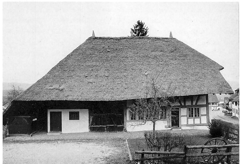
Das letzte Strohdachhaus im Kanton Zürich in einer historischen Aufnahme und heute. Eine der beiden Stuben diente der Gemeinde im 19. Jahrhundert als Schulzimmer.