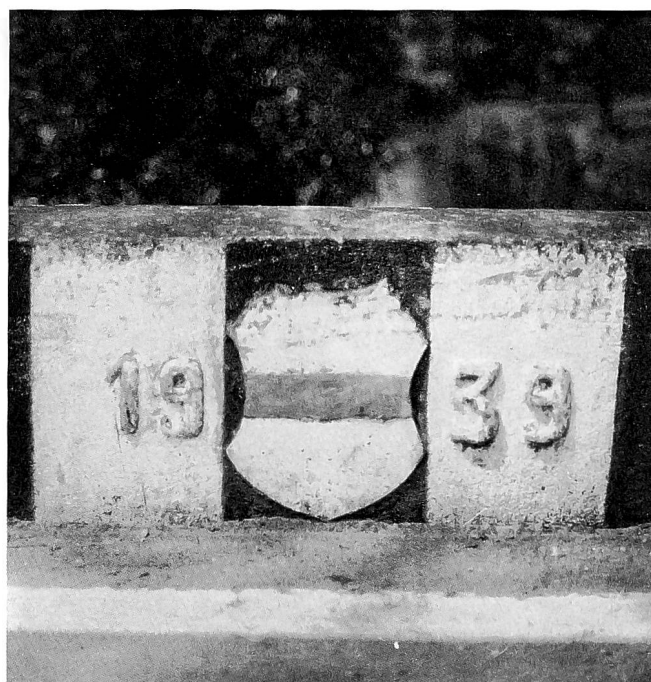
Lorzebrücke Bibelos von Südosten und Teil der Brüstung.