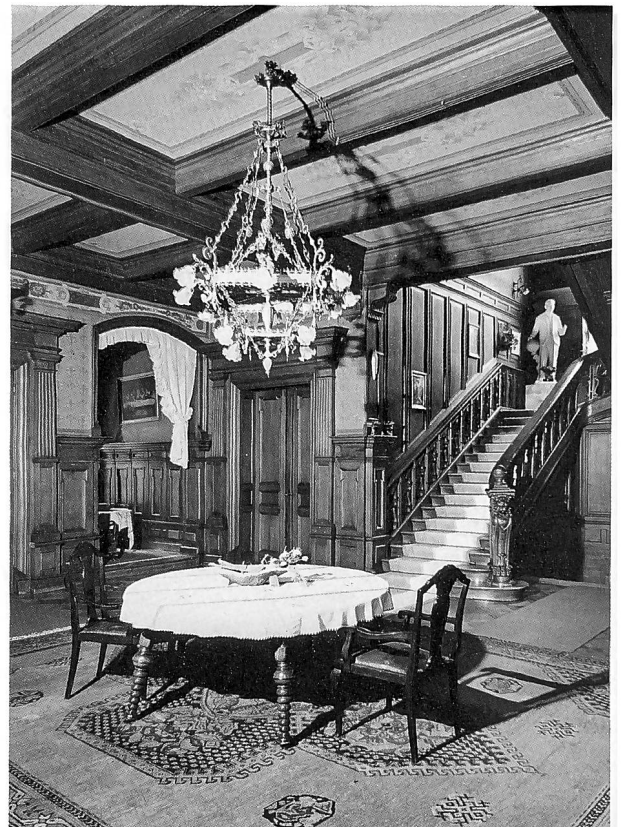
Das Schloss Wart bei Neftenbach wurde 1889 als reich verziertes «Märchenschloss» oberhalb der Töss errichtet. Die aufwendige Gestaltung des Äusseren findet im Inneren eine Entsprechung, wie der Blick in die Eingangshalle zeigt.