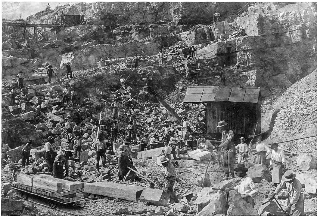
Die Steinbrüche Nr. 1, 3, 4 und 5, 1926. Die Ränder wurden vom Fotografen beim Entwickeln absichtlich überbelichtet, um den Lägersteinbruch hervorzuheben. Am unteren Bildrand ist die Wehntalerstrasse zu sehen. Lägersteinbruch Steinmaur, um 1905. Der Auslegearm des Krans ist aus Holz. Die Szene wurde vom Fotografen bis ins Detail arrangiert. Wegen der langen Belichtungszeiten mussten alle Personen einen Moment lang stillhalten.