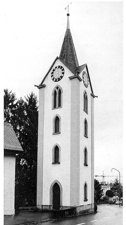
Der Kapellenturm in Rieden geht auf eine heute verschwundene Kapelle zurück und ist das Wahrzeichen der Dorfschaft Rieden. Er wurde im Zusammenhang mit einem Strassenprojekt 1866 neu errichtet.