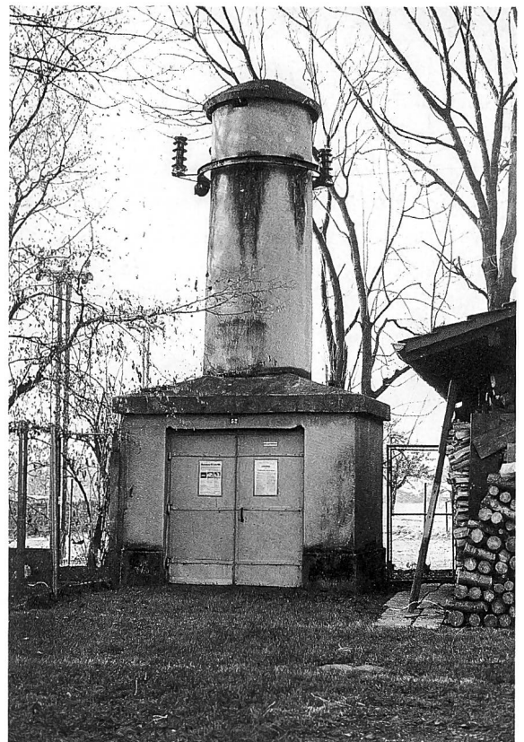
Die letzte im Kanton Zürich erhaltene Transformatorstation dieses Typs entstand um 1905 und war der Stolz der Färberei Jucker, wie der Briefkopf zeigt.