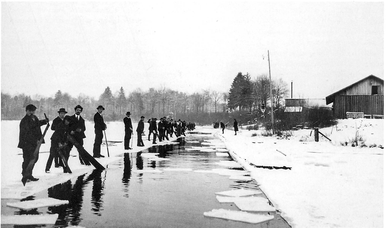
Kühles Bier und frischer Fisch dank Natureis aus dem Katzensee. Zwischen 1880 und 1920 wurde am Katzensee kommerziell Eis gewonnen und in vier isolierten Eiskellern eingelagert, von denen einer am Ufer erhalten blieb.