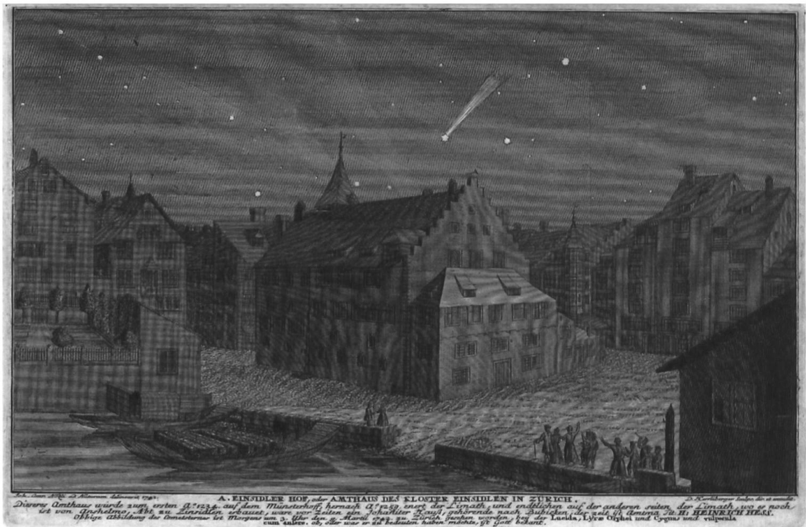
Einsiedlerhof mit dem Kometen vom 9. März 1742, gezeichnet von Johann Conrad Nözli, gestochen von David Herrliberger. (Zentralbibliothek Zürich, Graphische Sammlung)