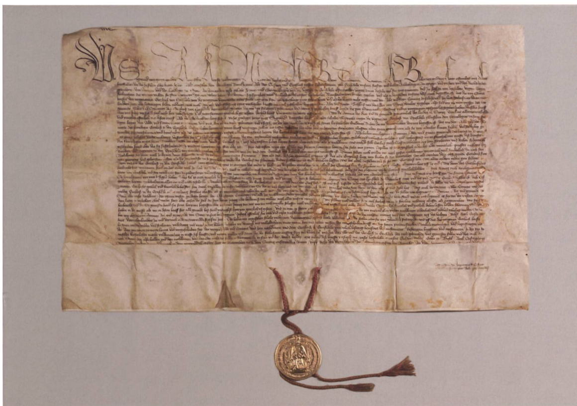
Die goldene Bulle Sigismunds von 1434 für Einsiedeln. (Klosterarchiv Einsiedeln, A.XI.9)

nur Rechte verleihen konnte, über die er von Reichs wegen verfügte, legten die Schwyzer als Abschrift eine differenziertere Umschreibung der Vogteirechte vor. Den Wortlaut entnahmen sie einem Schriftstück der Habsburger, das vermutlich 1415 bei der Eroberung des vorderösterreichischen Archivs in Baden erbeutet worden war. 31 Anfang Dezember 1433, als Sigismund auf dem Weg von der Krönung in Rom in Basel Halt machte, suchten Boten der Schwyzer den Herrscher auf. Am 11. Dezember übertrug der Kaiser die Klostervogtei endgültig den Schwyzern. Diese liessen sich die Rechte mit einer goldenen Bulle besiegeln und brachten damit die Bedeutung des kaiserlichen Briefes und den Sieg über den Einsiedler Abt auch symbolisch zum Ausdruck.