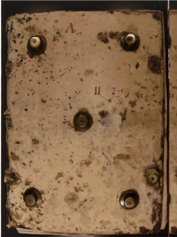
Mit Schafsfleder überzogener Einbanddeckel des Burkardenbuchs mit Messingbuckeln. Diese Metallbeschläge sollten den Einband, der im 15. Jahrhundert liegend aufbewahrt wurde, vor Abnutzung schützen. (Klosterarchiv Einsiedeln, A.II.2)

mit anderen Texten verknüpft, reorganisiert und in neuen medialen Formen aufbereitet. Im Zentrum dieser Reorganisation stand das nach Abt Burkard von Krenkingen-Weissenburg benannte Kartular – eine sorgfältig abgefasste, stattliche Handschrift. 44 Dank der Bestimmung von drei verschiedenen Wasserzeichen sowie der Analyse der im Burkardenbuch enthaltenen Urkunden lässt sich seine Abfassung in die 1430er-Jahre datieren. Während der Schriftraum dieses Kartulars Kopfregesten und Vollabschriften der Urkunden sowie originalgetreu abgebildete Herrschermonogramme und Rekognitionszeichen aufweist, befinden sich an den Rändern Schlagworte und Foliozahlen. Auf der ersten und letzten Seite des Burkardenbuchs sind Spuren abgefallener Siegel vorhanden. 45 Und an den Seitenrändern des Kopialbuchs finden sich Einträge der Hand Reinhard Stahlers, der im Auftrag des Abts in Überlingen vom König eine Bestätigung der Regalien erwirkte.