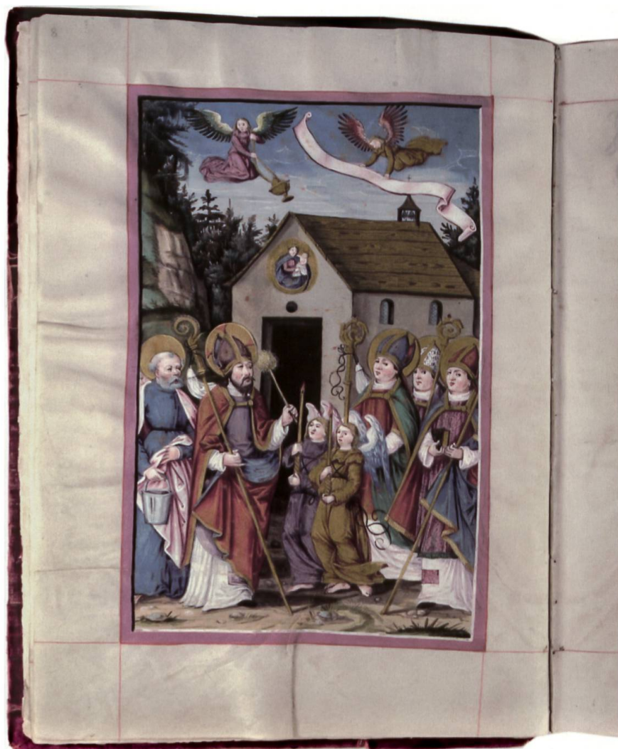
Das Guttäterbuch. Die aufgeschlagene Seite zeigt die Engelweihe in einer Illustration aus dem frühen 16. Jahrhundert. (Klosterarchiv Einsiedeln, A.WD.11)