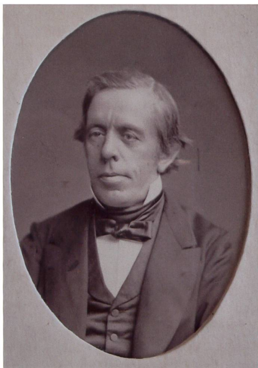
Georg von Wyss (1816–1893) war ein Opfer der politischen Umwälzungen. Er gab nicht nur seine Tätigkeit als Staatsschreiber auf, sondern wurde auch als Nachfolger Meyers von Knonau als Staatsarchivar verhindert. Als Ordinarius für Schweizergeschichte an der Universität und als langjähriger Präsident der AGGS diente er später ausschliesslich der Geschichtswissenschaft.

der Siegel ganz vorzüglich versteht, nach Einsiedeln käme und zu den Stunden, die Sie ihm bestimmen würden, Abdrücke der Siegel nähme, die wir noch nicht besitzen?» Und um mögliche Ängste betreffend entstehender Schäden zu mindern, fügte er noch an: «Beim Abgiessen der Siegel wenden wir ein eigenes Verfahren an, wobei das Original nicht der geringsten Gefahr ausgesetzt wird. Es wird nämlich dasselbe zuerst mit Wasser und einem weichen Pinsel vom Staub befreit, dann wird ein ganz weicher Kitt darauf gedrückt, sachte vom Siegel abgenommen und die so erhaltene Matrize mit Gips ausgegossen.» 23 Die Anfrage war erfolgreich. Im Protokoll der Gesellschaft wird 1848 unter «während des Sommers eingegangenen Gegenständen» vermerkt: «Eine Tafel Abdrücke der in den Archiven v. Einsiedeln und Altdorf befindlichen Stempel.» 24