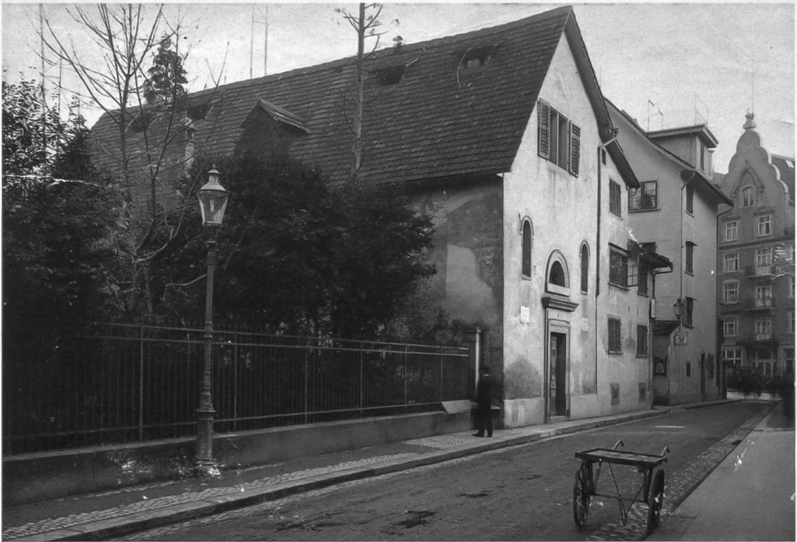
Die spätmittelalterliche St.-Anna-Kapelle kurz vor ihrem Abbruch.