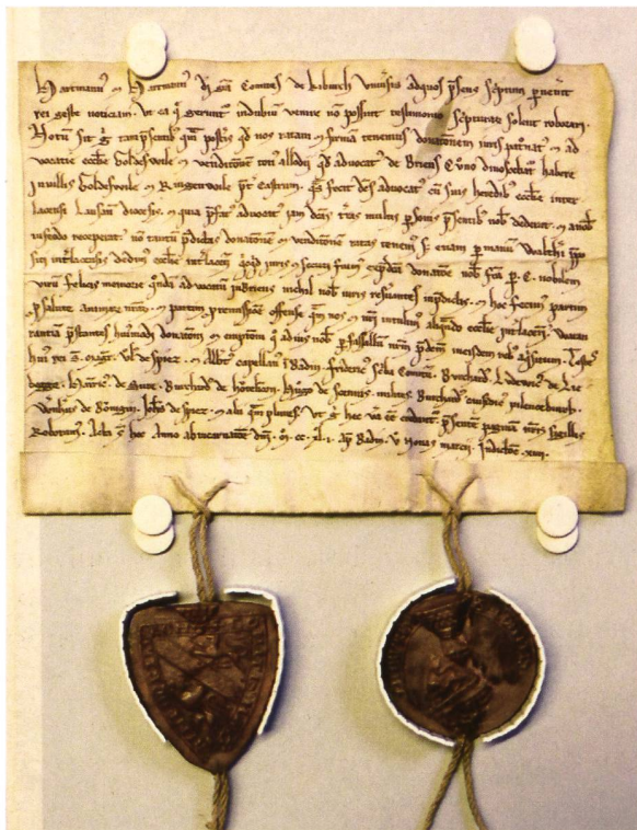
Baden als Residenzort: Am 3. März 1241 verzichteten in Baden die beiden Grafen von Kyburg gegenüber dem Kloster Interlaken auf ihre Lehensrechte. Unter den Zeugen befindet sich auch der Kaplan von Baden. (Staatsarchiv des Kantons Bern, Urkunden, Fach Interlaken)

näher charakterisieren. Bevor die herrschaftliche Situation zwischen Kyburg und Rapperswil mit der Gründung des Klosters Wettingen geklärt war, ist von einer vergleichsweise schwachen Einflussnahme der Kyburger in Baden auszugehen. Dies scheint sich aber in den folgenden zwei Jahrzehnten geändert zu haben. Eine Reihe von Belegen weist darauf hin, dass sich die Siedlung in der Klus zwischen der Burg Stein und der Limmat entwickelte. Von 1235 stammt die erste Erwähnung des «castrum» von Baden, das heisst wahrscheinlich der Burg Stein. Die Burg wird von Magister Ulrich versehen, wohl einem Verwaltungsbeamten der Kyburger. 1242 folgt ein erster Hinweis auf eine Brücke, 1265 schliesslich das «castrum de ponte de Baden», das heisst die sogenannte niedere Burg bei der Brücke, das spätere Landvogteischloss. 12 Das Kyburger Urbar nennt den folgenden Besitz: Zur «villa» Baden gehörten zwei Höfe, zwei weitere Lehen, 52 Schupposen (in kleinere Einheiten zerfallene Höfe), drei Mühlen, nicht näher spezifizierte Tavernen sowie der Hof in Dättwil. 13 Das Habsburger Urbar aus dem Beginn des 14. Jahrhunderts bestätigt diesen Besitz. Die Beschreibung lässt die Struktur eines relativ grossen, hochmittelalterlichen Fronhofs erahnen, das heisst einer ländlichen Siedlung mit Eigenkirche, Herren-