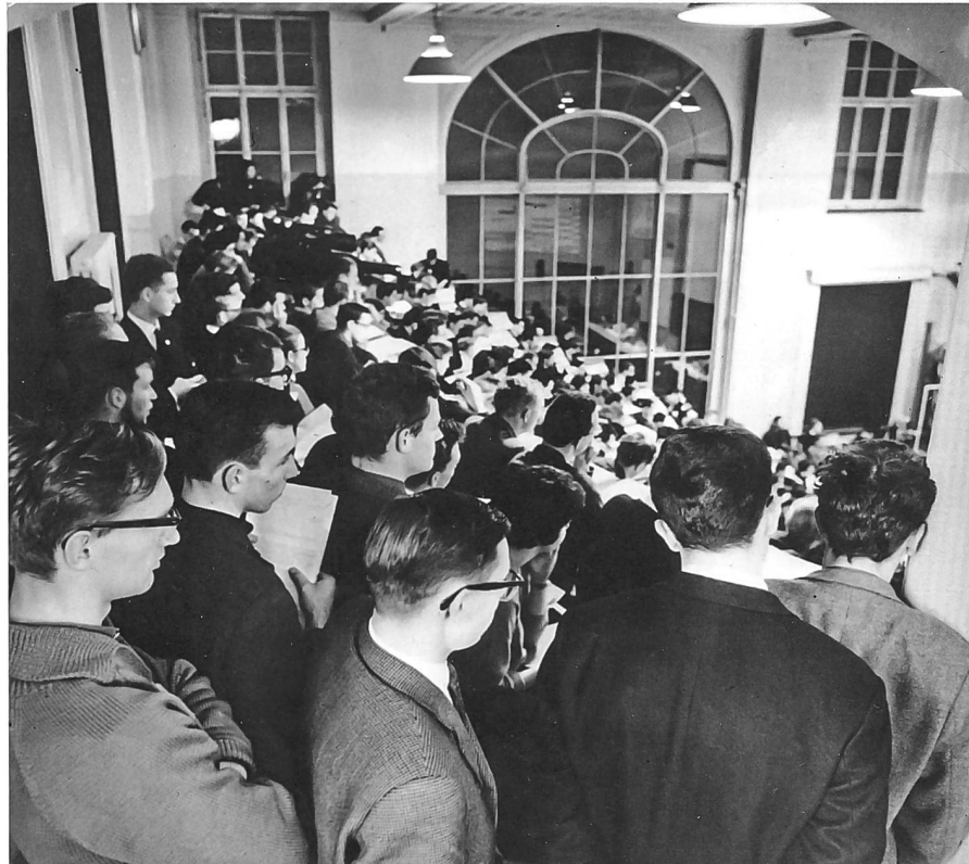
Abb. 1: Raumnot: Universitäten befinden sich in klassischen Bauten und gehören in die Stadt. Die markante Zunahme der Zahl der Studierenden vor und vor allem nach dem Zweiten Weltkrieg stellten diese Maximen auf die Probe. Studierende an der Universität Zürich, um 1960.

über 8000 Studierende. In den 1960er Jahren wurde an der Universität Zürich fast eine Verdreifachung der Zahl der Studierenden realisiert. 7