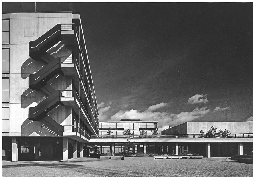
Abb. 6: Die Uni Irchel nach der Eröffnung 1981: Das zu knappe Raumangebot war für die wachsende Universität nach dem Zweiten Weltkrieg das Hauptproblem. Die Lösung mit dem neuen Campus auf dem Irchel-Gelände war ein Befreiungsschlag sondergleichen!

wir genügend Platz und Raum zur Verfügung stellen. Die Verlegung eines Teils der Universität auf das Strickhofareal ist keine Quartierfrage, sondern eine schweizerische.» 60 Und der unbestrittene Leader der Zürcher Sozialdemokratie, Erwin Lang, 61 selbst nicht Kommissionsmitglied, führte gegen Ende der Debatte aus: «Es ist an der letzten Sitzung von den Rednern der Minderheitsanträge wieder das Rüttilied der Strickhofwiese gesungen worden. Es ist aber nicht nur keine bessere Lösung, sondern überhaupt keine vorgeschlagen worden. Es geht nicht nur um die Linderung eines Notstandes an der Universität, sondern es geht um die Auseinandersetzung zwischen Ost und West. Vor dem Kriege hatten sie z. B. in Polen auf 10 000 Einwohner 14 Studierende, heute sind es 62. In England sind es 37, in Schweden 54, in Italien 39 und in Frankreich 61 Studenten.» Und er schloss mit der programmatischen Haltung: «Das Recht auf Bildung und das Recht, dass jeder den Bildungsgang beschreiten kann, der seinen Anlagen und Möglichkeiten entspricht, ist ein vornehmes und jahrzehntelanges Postulat der Sozialdemokratischen Partei.» 62 Dieses herrliche Ratsvotum ist so etwas wie die programmatische Grundhaltung der Sozialdemokraten zur Hochschulbildung. Der politische Kontext, so etwa der «Ost-West-Gegensatz» und der konstatierte «Rückstand» der Schweiz im internationalen Vergleich, liess die Sozialdemokraten den vormals kritisierten Klassencharakter