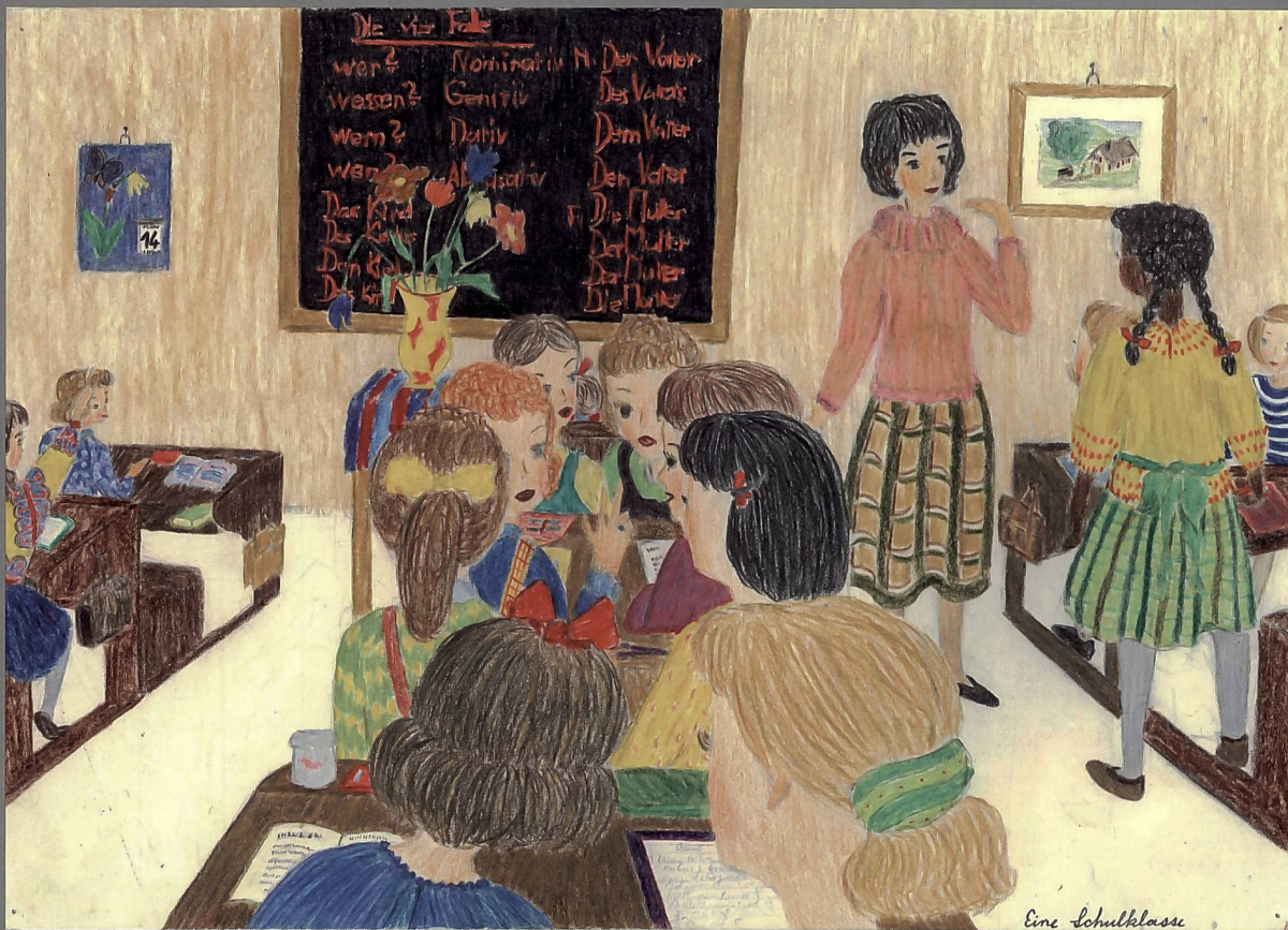
Abb. 1: Als warm, farbig und familiär erscheint die Schule in der Zeichnung «Eine Schulklasse», mit der 1960 ein dreizehnjähriges Mädchen am jährlich im «Pestalozzi-Kalender» ausgeschriebenen Wettbewerb teilnahm.