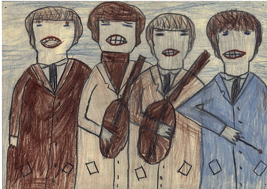
Abb. 2: Die neue Jugendkultur beeinflusste auch Primarschüler: «BEATELS.» Zeichnung eines achtjährigen Knaben für den jährlich im «Pestalozzi-Kalender» ausgeschriebenen Wettbewerb, 1966.

nardirektoren und Wissenschaftler – insbesondere Bildungsforscher, Philosophen und Theologen. An der thematischen Ausrichtung dieser Referate und der Auswahl der eingeladenen Experten lässt sich ablesen, welche Themen und Entwicklungen im schulischen Bereich in den späten 1960er Jahren als prägend erachtet wurden.