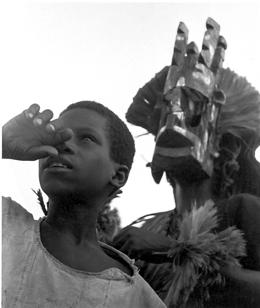
Abb. 2: Das Bild eines «Dogonjünglings» entstand im Frühjahr 1960 in Mali. Parin schrieb dazu: «Er blickt hoffnungsvoll in die bessere Zukunft [...]. Doch hinter ihm erhebt sich drohend oder geheimnisvoll die Tanzmaske, mit der die Dogon die Lebenskraft ihrer verstorbenen Vorfahren verteilen.» Zitiert nach Paul Parin: Zu viele Teufel im Land. Aufzeichnungen eines Afrikareisenden, Klagenfurt 2008, S. 11.

satz von individueller Psyche und allgemeiner Gesellschaft suchte man aufzuheben, indem man sich besonders für frühkindliche Sozialisierung interessierte. 9