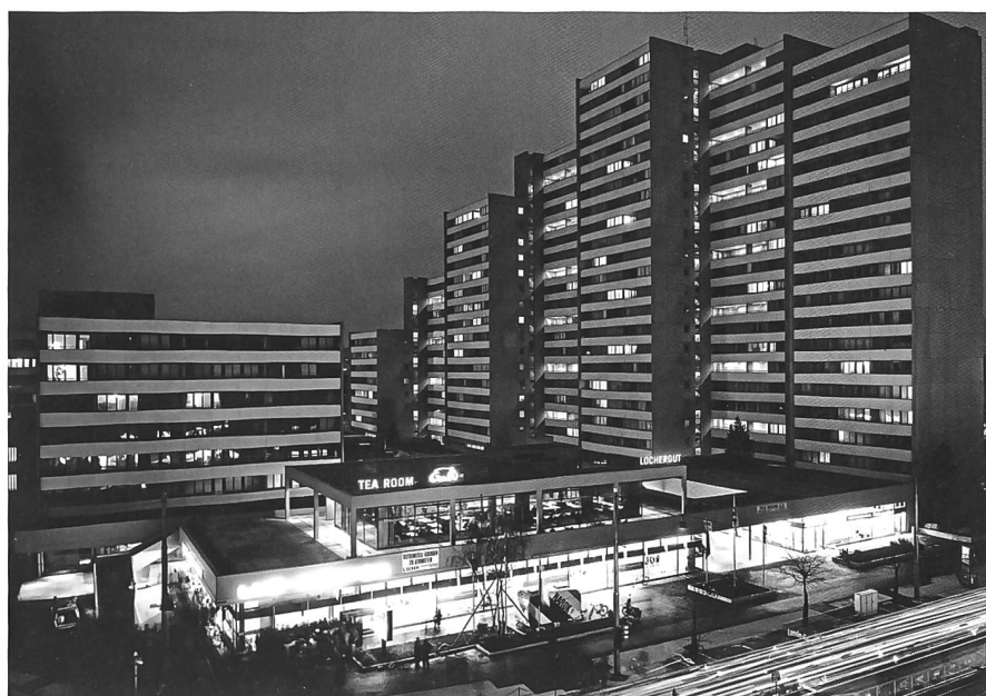
Abb. 3: Frisch fuhr einen Jaguar und leistete sich Wohnsitze in Europa und in den USA. Nicht immer war er glücklich mit dem Wohlstand, den er seinen Roman- und Theatererfolgen zu verdanken hatte, so etwa, als er ab 1965 in der Siedlung Lochergut in Zürich eine neue Wohnform erprobte.

tet ist, und im übrigen arbeitet der Non-Konformist an seiner Karriere», heisst es dazu in Frischs «Biografie» von 1966/67. 16