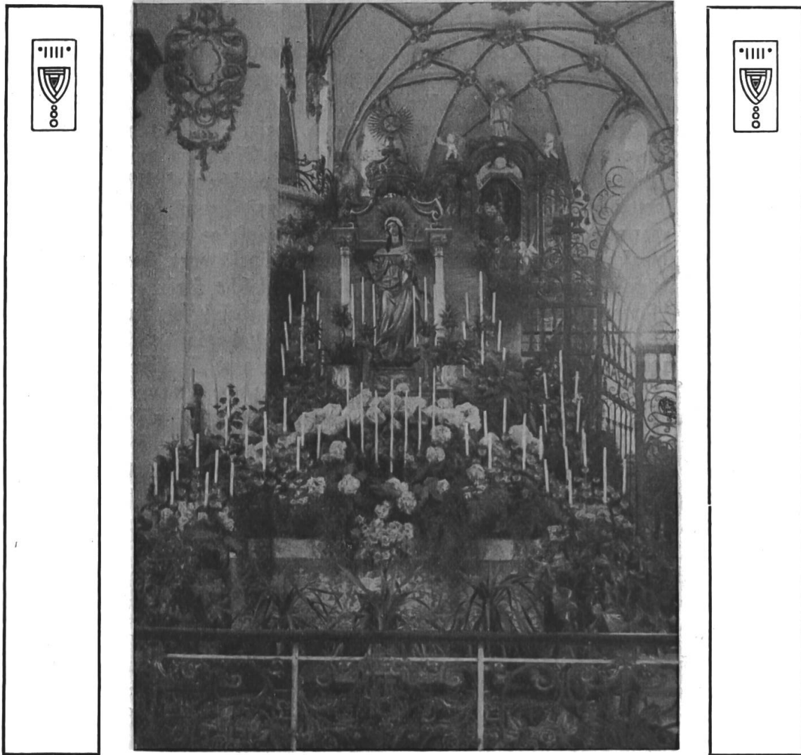
Maialtar in Maria Stein.

noch heute gefährlich und beschwerlich ist. Man hat ausgerechnet, daß die Wegstrecke, welche die hl. Familie bis nach der römischen Provinz Aegypten zurückzulegen hatte, zirka 40 Stunden betrug, daß sie also 8—10 Tage und Nächte unterwegs sein mußte. Und noch etwas. Vielleicht hatten sich Joseph und Maria von den Geschenken der drei Weisen etwas aufgespart; allein selbst das Gold konnte ihnen nicht viel nützen, denn der Weg zog sich größtenteils durch die Wüste hin. Es war also eine Reise mit vielen Entbehrungen, welche auch das zarte Jesuskindlein zum herben Schmerz für seine Mutter erdulden mußte.