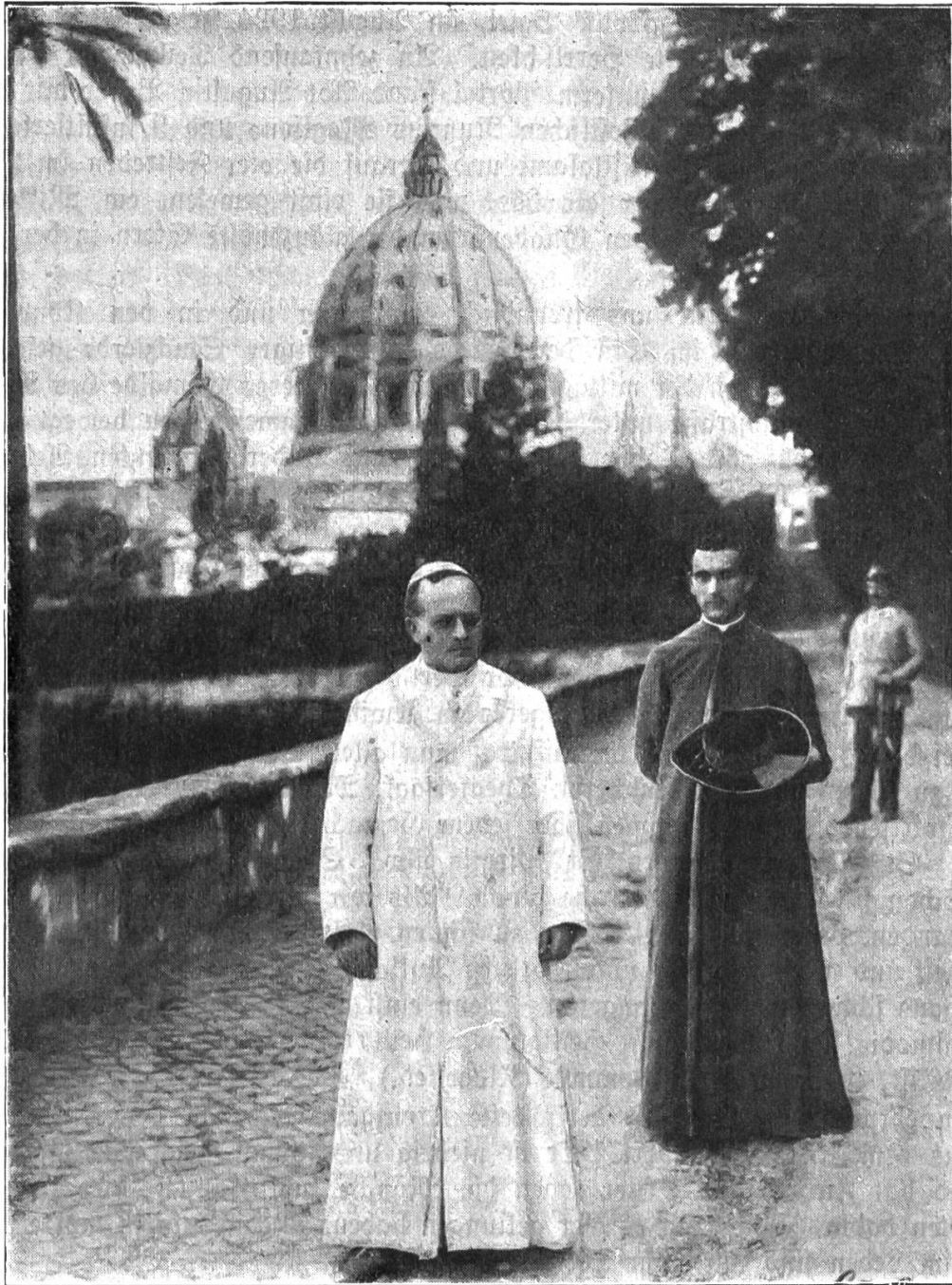
Der heilige Vater im päpstlichen Garten. Im Hintergrund die imposante Kuppel vom Petersdom.

uns hier die klassizistische Zeit ein bedeutendes Denkmal: Die Fassade ist Empire, das Innere im feinsten Rokoko. Vom Gewölbe leuchtet es in Irisfarben und Gold: die Stukkaturen gleichen Hyazinthenbeeten im Mai.