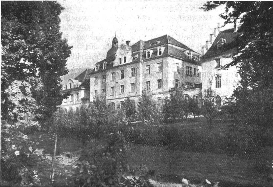
St. Gallus-Stift von Westen

bitten um Gnade und Segen des Himmels? Weil sie glauben, das Kind zu Bethlehem ist der Schöpfer und Herr der Welt, ist der König der Engel und Menschen, ist der ewige, unerschaffene, unabhängige, allmächtige, heilige Gott; weil sie glauben, alle irdischen Könige und Richter des Volkes sind erschaffene, also abhängige, Rechenschaft schuldige Menschen, sind arme Sünder, die einen Heiland und Erlöser brauchen, die zur guten Regierung der Untergebenen Gottes Gnade und Segen nötig haben, weil sie glauben an des Psalmisten Wort: „Wenn der Herr das Haus nicht baut, so bauen die Bauleute umsonst.“ Zur Anerkennung der absoluten Herrschaft des Christkönigs opfern sie ihm das Gold der Liebe, als Ausdruck ihres Glaubens an seine Gottheit streuen sie ihm den Weihrauch,