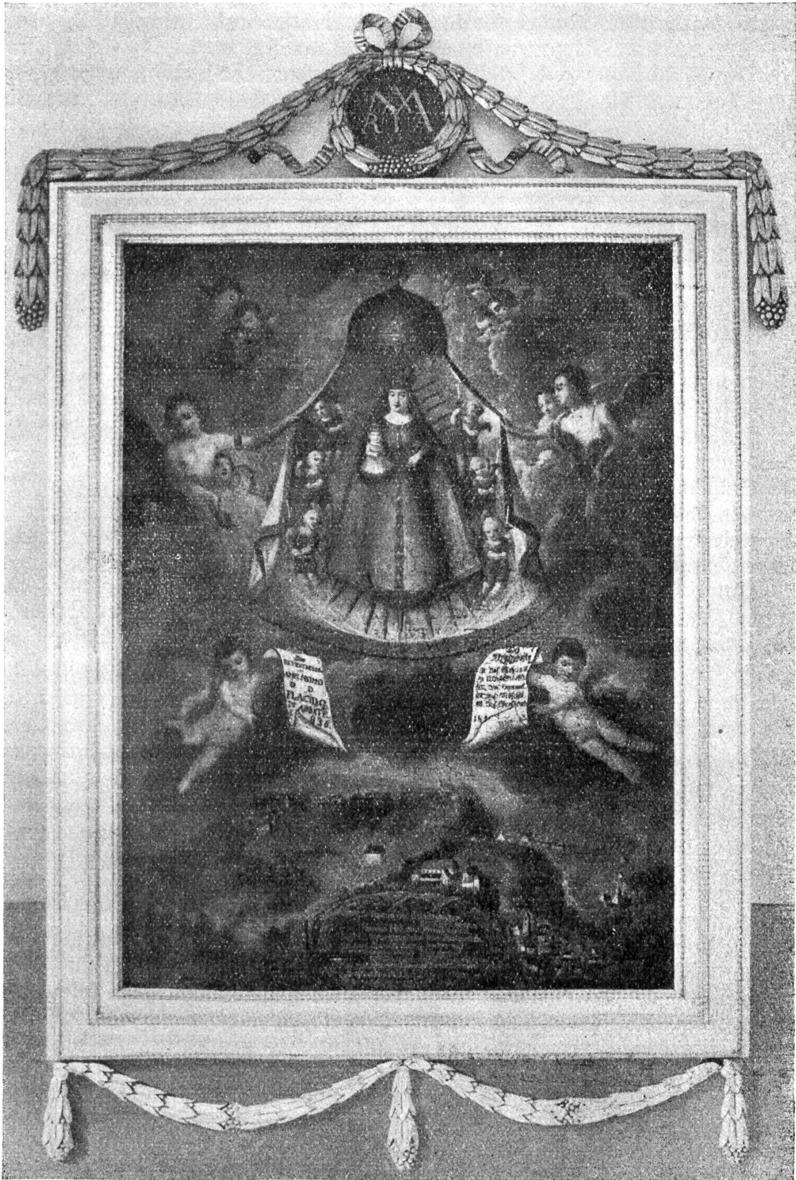
Grosses Votivbild der Gemeinden: Hofstetten, Metzleren, Rodersdorf und Witterswil / Bättwil