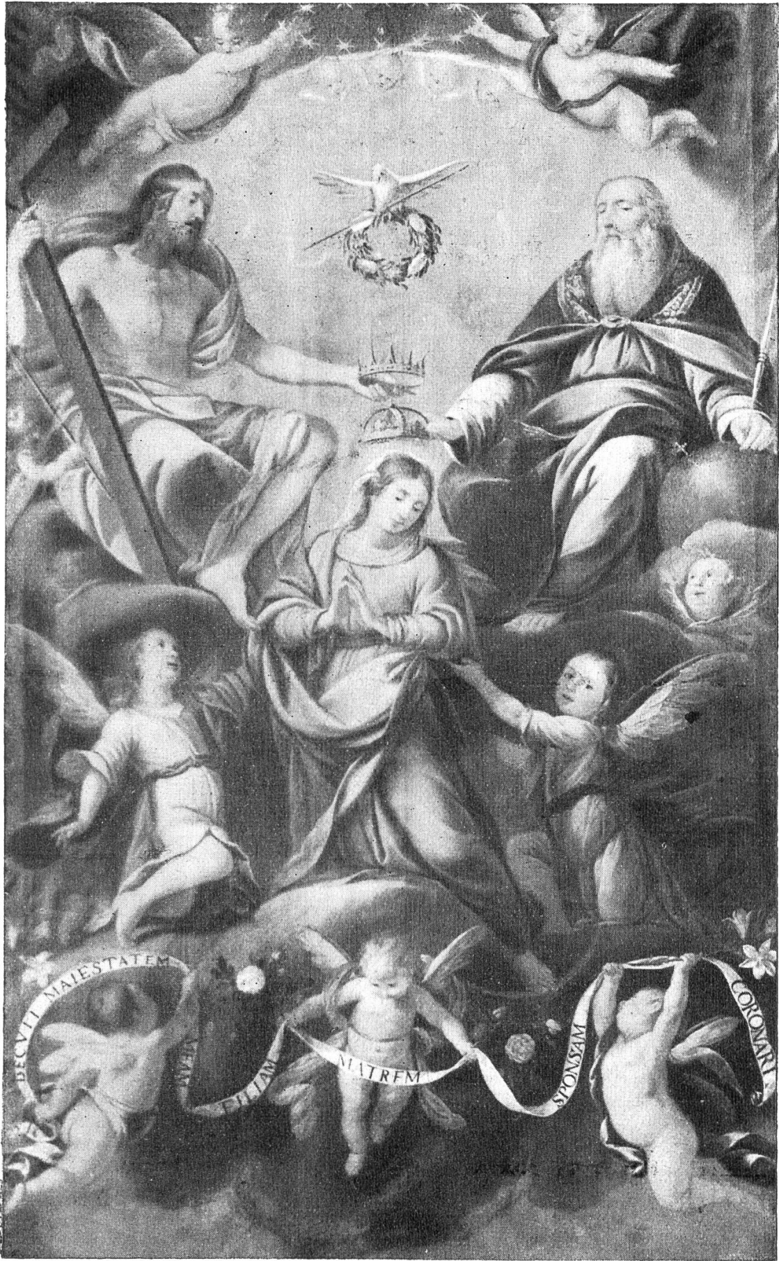
Mariä Krönung — ein Hochaltarbild der Basilika zu Mariastein