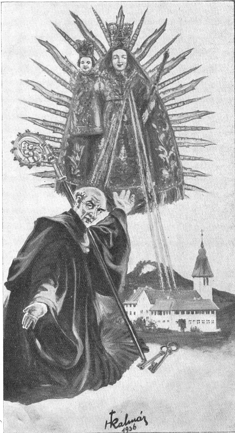
Das neue obere Altarbild vom Hochaltar zu Mariastein. Es stellt den sel. Esso, ersten Abt des Klosters Beinwil dar, wie er im Geiste zu Füßen der Muttergottes im Stein kniet, ihre Verehrung daselbst voraussieht und sie ihn und seine Klostergründung segnet.