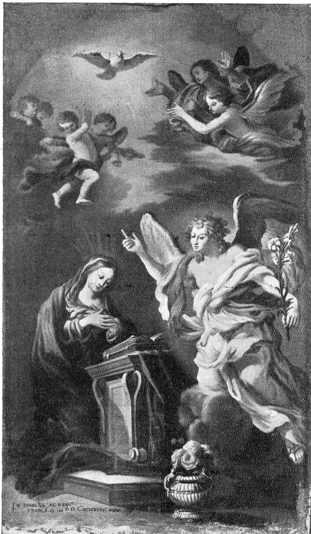
Ein Hochaltarbild der Basilika zu Mariastein Maria Verkündigung