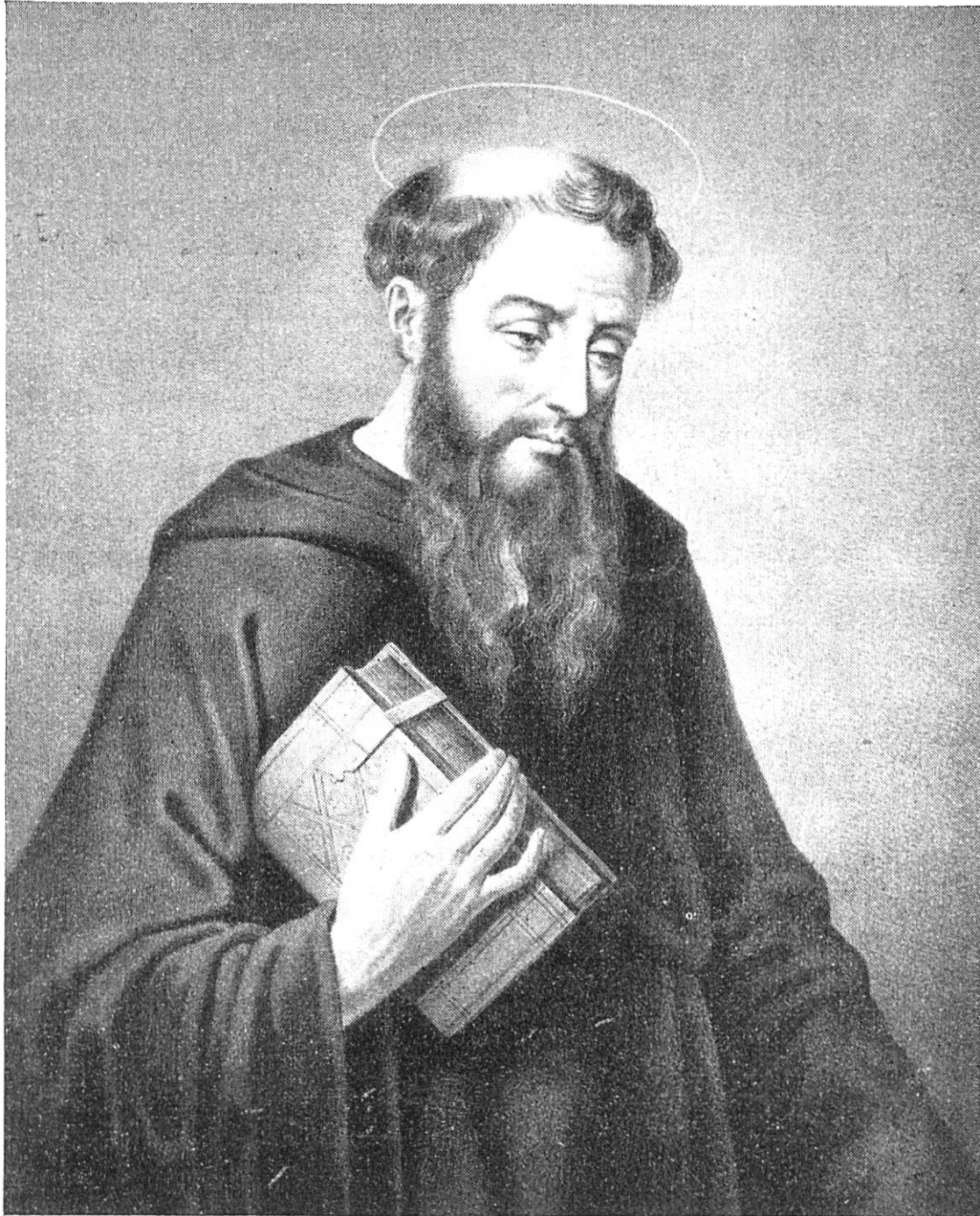
Der Heilige Benediktus

„Keiner folge im Kloster seinem eigenen Willen“, das ist St. Benedikts Grundsatz. Gehorsam ist das goldene Lebensgesetz des Jüngers Christi. Das verkündet er schon dem Neuling in der Vorrede zu seiner Regula: „Rehre durch des Gehorsams Mühsal zu dem zurück, den du durch des Ungehorsams Trägheit verlassen hast.“ Denn gerade hier entscheidet es sich endgültig, „ob einer wahrhaft Gott suche“, ob einer in Wahrheit Christus nachfolgen will. Sagt doch der göttliche Meister selber: „Ich bin nicht gekommen, meinen Willen zu tun, sondern den Willen desjenigen, der mich gesandt hat.“ (Jo. 6, 38.) Nicht der Eigenwille leitet den Mönch, sondern der Gehorsam dem Abte gegenüber und das treue Verharren in der brüderlichen Gemeinde. Durch sie gelangt er zur Bekehrung der Sitten, die seine tägliche Lebensarbeit bedeutet. In solch hoher Tugend sah Benediktus eine Nachahmung Christi des Herrn, der als Gottmensch zum Ganzopfer geworden ist. In dieser engsten Nachfolge Christi sieht