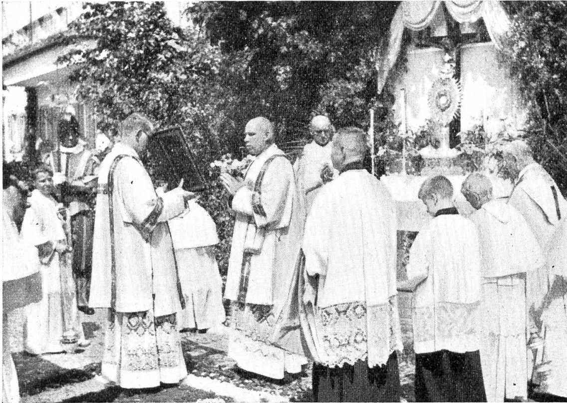
Ein Altar bei der Fronleichnamsprozession