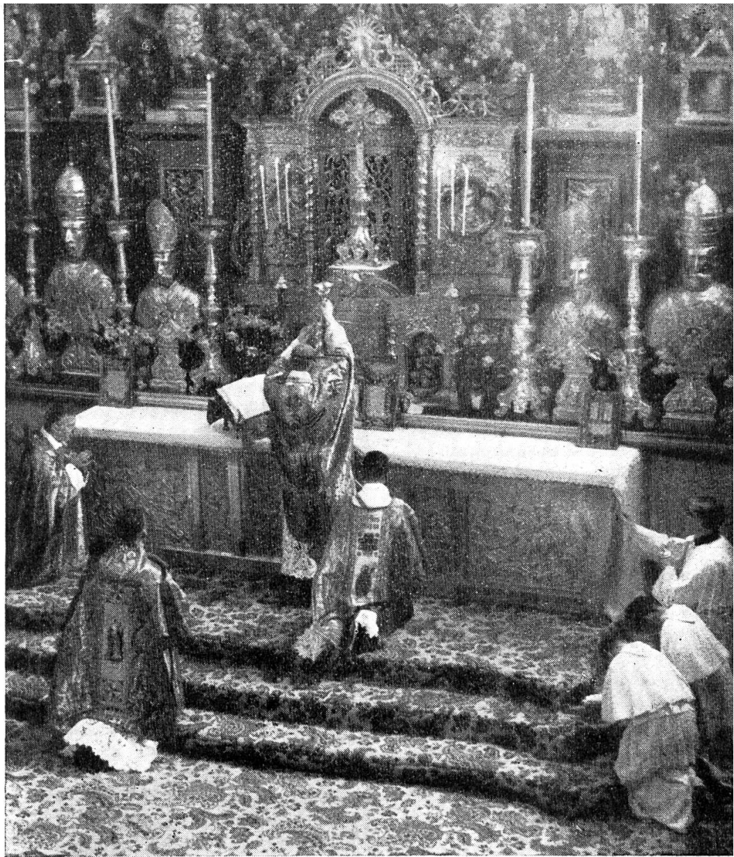
Wandlung der hl. Primiz

Feld und Flur, vor allem für die unverdiente Wohltat des Friedens. Noch immer wütet der schreckliche Völkerkrieg und fordert Opfer ohne Zahl. Schuld daran ist die große Abkehr von Gott, die Sünden der Menschen. Soll wieder Friede werden, dann müssen wir gleich Maria unser persönliches Leben, unser Familien- und Völkerleben nach Gottes heiligem Willen einrichten. Wir müssen mit Gott im Frieden leben; das ist die Grundbedingung des häuslichen und sozialen Friedens.