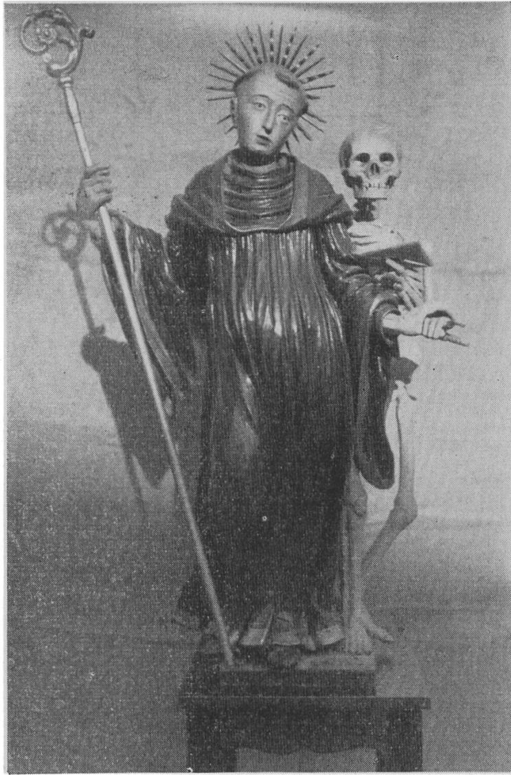
St. Fridolinsbild aus der Katharinakirche Laufen

viele Teile von Baden und Württemberg und der Schweiz. Selbst an Wundern fehlte es nicht, die zum Gelingen des Werkes beitrugen.