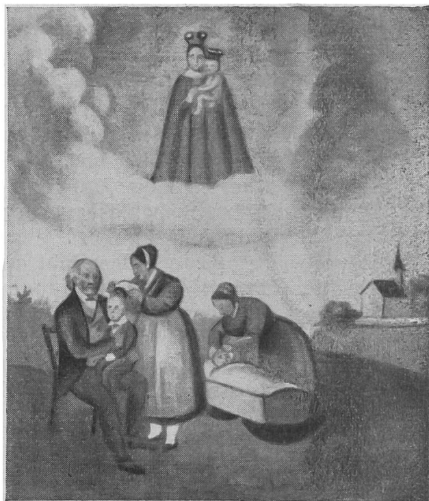
Abb. 8, links.