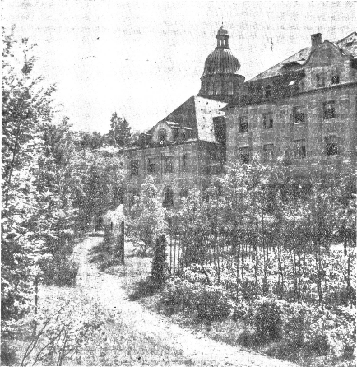
St. Gallusstift zu Bregenz (Nordwestseite gegen die Stadt).

berg gegangen sei, in Tanzenberg wären sie mit offenen Armen aufgenommen worden. — Der Abt von Scheyern (Bayern) wünscht, daß aus dem neuen Kloster ein zweites St. Gallen entstehe und stellt seinen baldigen Besuch in Aussicht.