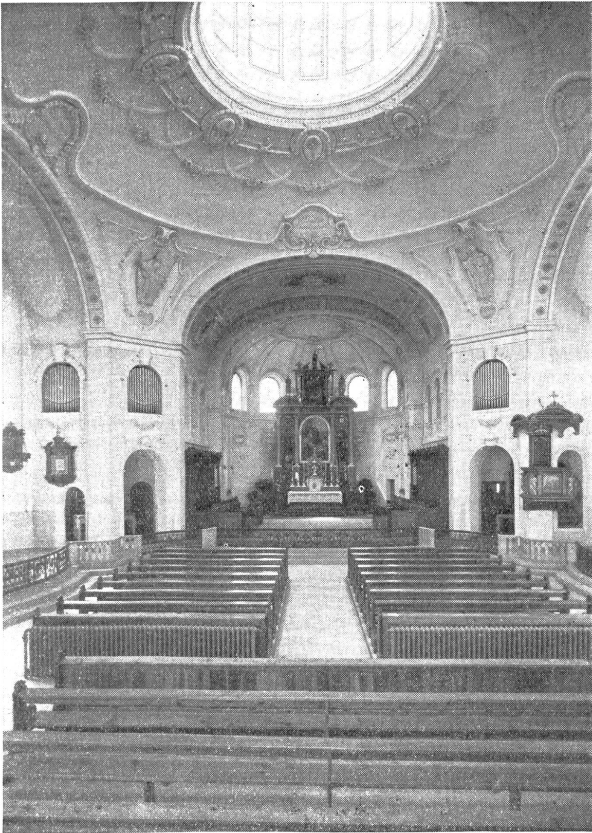
Inneres der Kirche vom St Gallusstift in Bregenz vor der Ausplünderung.