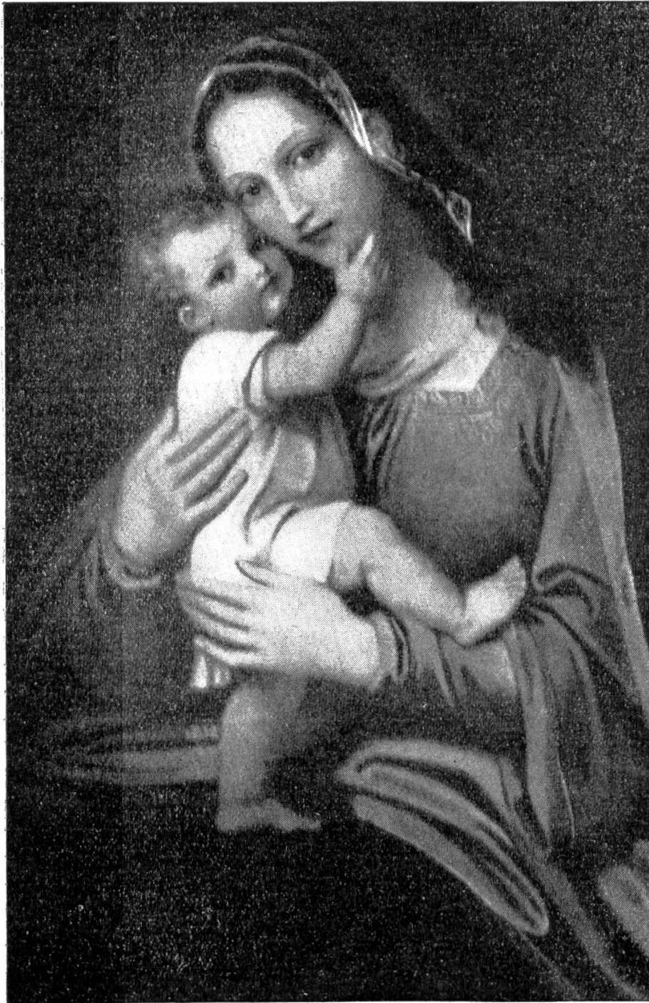
Hochaltarbild «Maria Hilf» im Kloster Gubel, Original von Deschwanden.