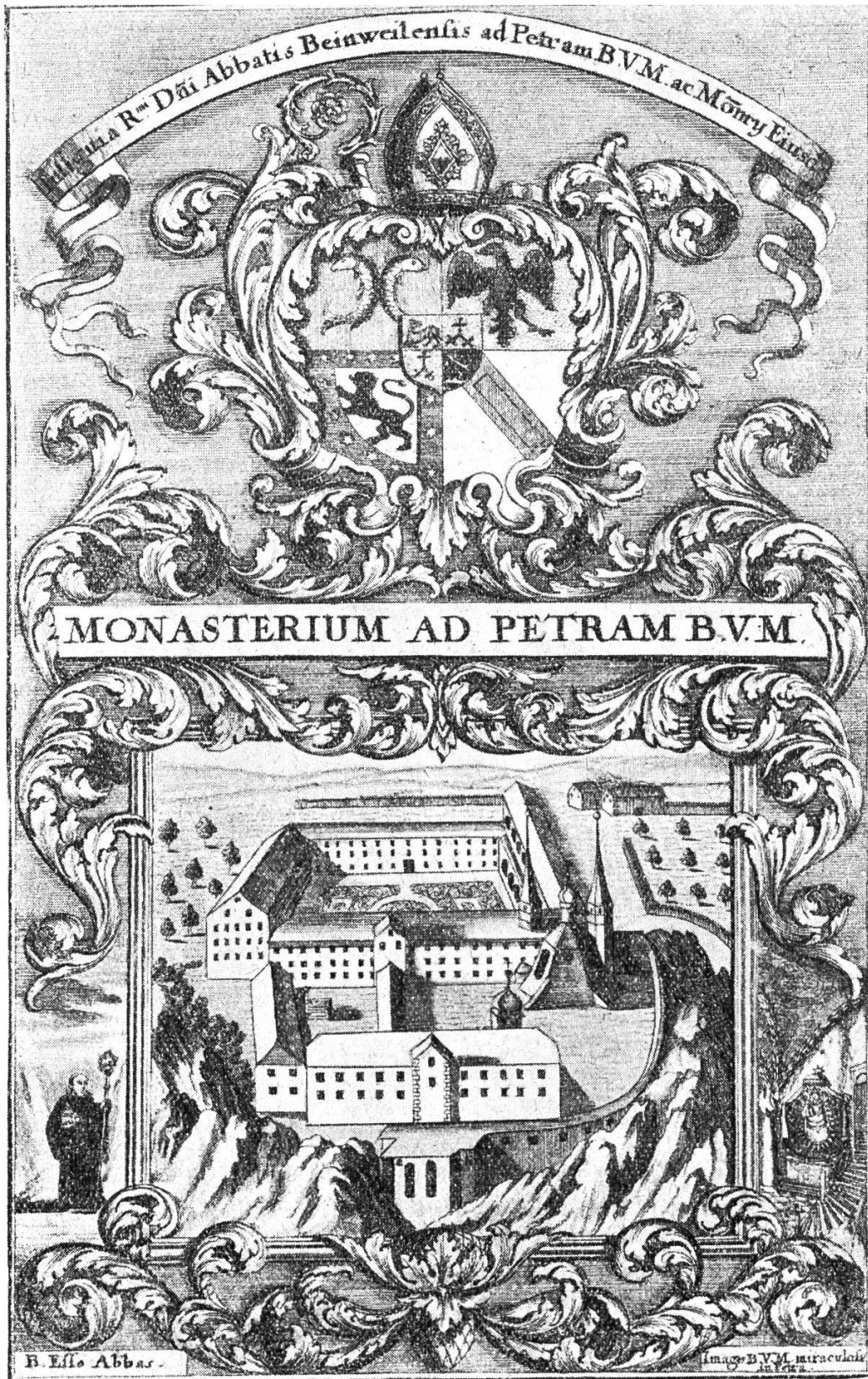
Legenda: Das ganzseitige Bild zeigt uns einen Idealplan (vermutlich des Abtes. Fintan Kiefer 1638—1675) vom Kloster Mariastein, der nur zum Teil ausgeführt wurde. In der linken Ecke unten steht abgebildet der erste Abt von Beinwil, der sel. Abt Ezzo von Hirsau; in der rechten Ecke sehen wir unten den Zugang zur Gnadenkapelle mit dem ersten wundertätigen Muttergottesbild. — Die obere Hälfte