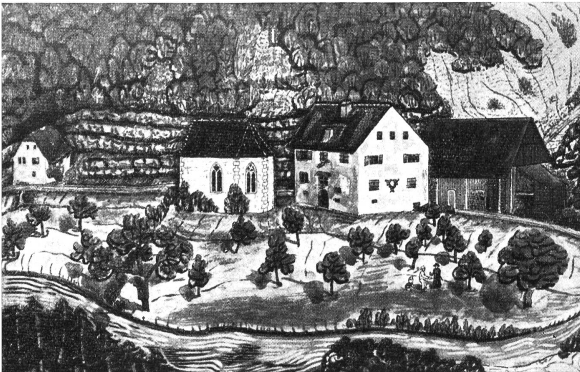
Kapelle im Chlösterli und ehemalige Propstei. Aquarell von P. Karl Motschi, Mariastein 1861. (Staatsarchiv Solothurn.)