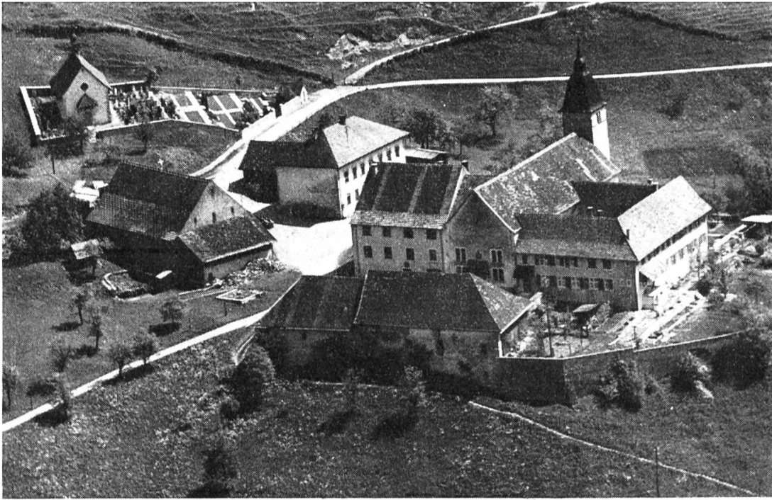
Klosteranlage von Beinwil an der Lüssel.

brennerei, die in der Frühzeit von Mönchen betreut gewesen. Sie dürfen wohl als erste handwerkliche Ausbildungsstätten des Tales angesprochen werden. Auf der Sonnenseite des Talgrundes wuchsen auf schmalen Bändern Hafer, Gerste und Hirse, und schattenhalb gab es ausgedehnte Viehweiden. Steigt man hinauf zum alten Klostergarten , summen die süßen Bienen im Schatten des Kirchturmes ihr ewig kostbares Lied und werfen dem emsigen Bienenvater einen erfreulichen Ertrag in die Waben. Äpfel, Birnen, Pflaumen, Zwetschgen, Feigen und Trauben haben im Beinwiler Klostergarten ihr altes Heimatrecht bewahrt und werden noch heute von sachkundiger Hand gepflegt und gehegt, wie es schon bei den Gottesfreunden in alter Zeit schönste Sitte war. Heilkräuter, stattliche Gemüsebeete, saftige Erdbeeren und Himbeer-Kulturen vervollständigen das universale Bild eines alten Klostergartens, in dem sich einfach alles Nützliche irgendwie finden sollte. Anmutige Rebgewinde umranken die solid vergitterten Fenster und geben dem Klösterlein einen träumerischen, romantischen Akzent.