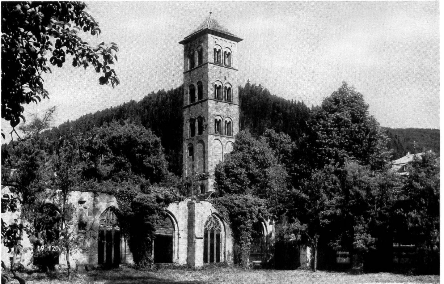
Der Eulenturm mit Kreuzgang