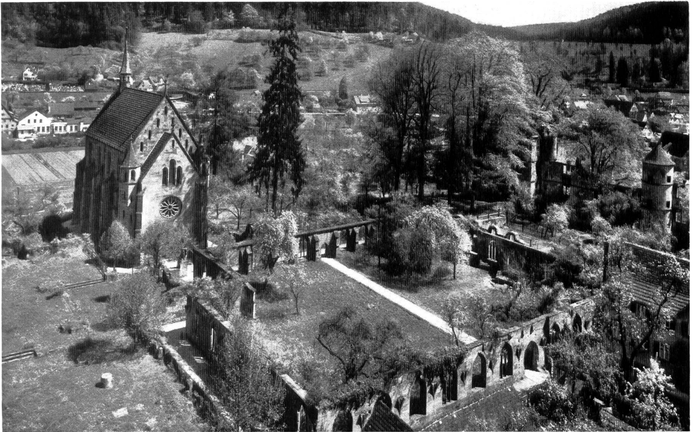
Marienkapelle mit Kreuzgang