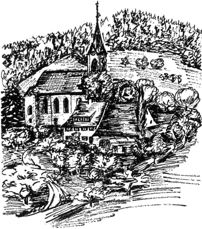
Oberkirch, wo sich die Nunninger und Zullwiler zum Gebete treffen.

waltete er als Pfarrer in Erlinsbach (24). Wer sollte an seine Stelle treten?