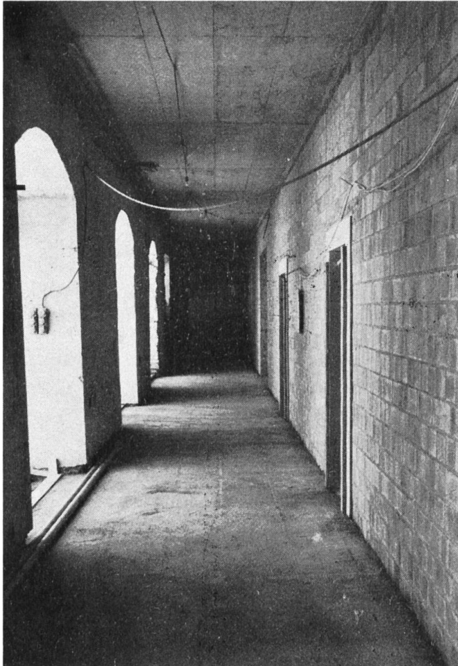
Bibliothekstrakt. Der südliche Kreuzgangarm im Rohbau.

zimmer und die Bibliothek montiert werden. Im Juli 1980 wurde mit dem Einordnen der Bücher begonnen.