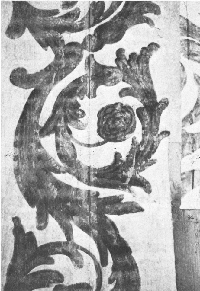
Gereinigte und ausgefasste Tafel.

friesbemalung der Rippen war wie die Rautenfüllungen von sehr schlechter Haftung.