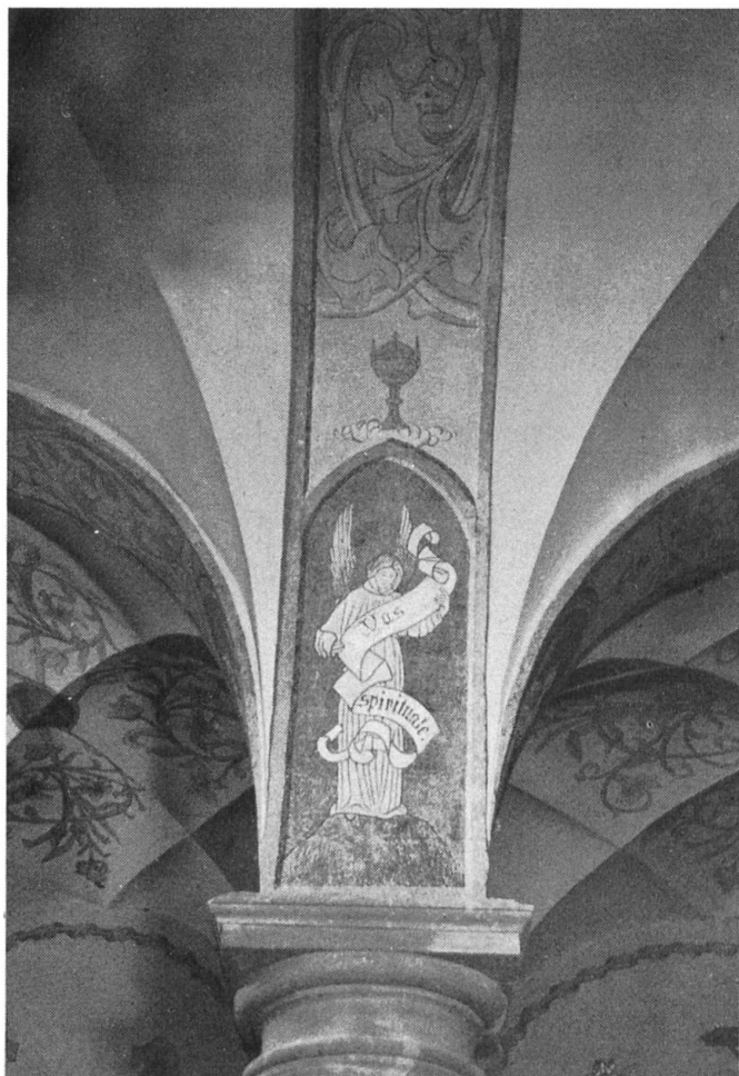
Sakristei. Gurtbogen, Detail. Text: Du geistliches Gefäss. Symbol: Kelch.

Diese Milieumalereien wurden erst bemerkt, als man die teilweise bis zum Grund abblätternden Farbschichten ablaugen musste. Die Loslösung der obersten Ölfarbanstriche von den bemalten Flächen war schwierig, da die Bemalung auch in Ölfarbertechnik ausgeführt war. Es war unvermeidlich, dass dabei auch einiges verloren ging. Durch farbliche und formale Wiederholungen der Ornamente liessen sie sich aber retuschieren oder ergänzen. Andere Verluste entstanden durch Verlegen von elektrischen Leitungen. Formwiederholungen wurden mit Pausen rekonstruiert und ergänzt. Bei den zwei Fenstern und bei der alten Türnische zur Benediktuskapelle kamen bei den Freilegungsarbeiten rote Sandsteinimitationen mit schwarz gemalten einfachen Fugen hervor.