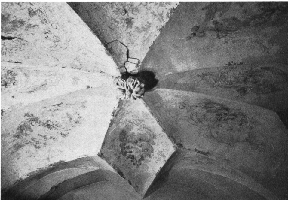
Konventstock, Erdgeschoss. Ein sehr schwieriges und nervenkostendes Unterfangen war das Hervorholen und Reinigen des Sternengewölbes an der Nordseite des Ganges.