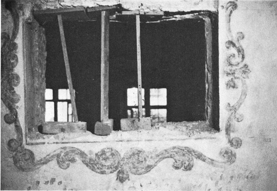
Querlüftungsfenster des Refektoriums. Gangseits waren die Fensteröffnungen ebenfalls mit grünen Rankeneinfassungen versehen.