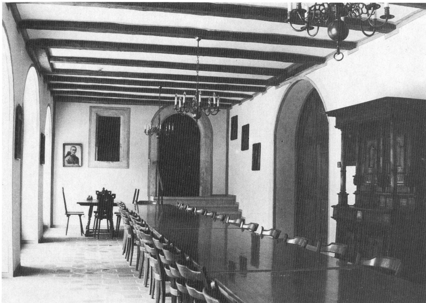
Der neu gestaltete Gemeinschaftsraum im Erdgeschoss des «Brüggli» (vergleiche folgenden Artikel Seite 150).