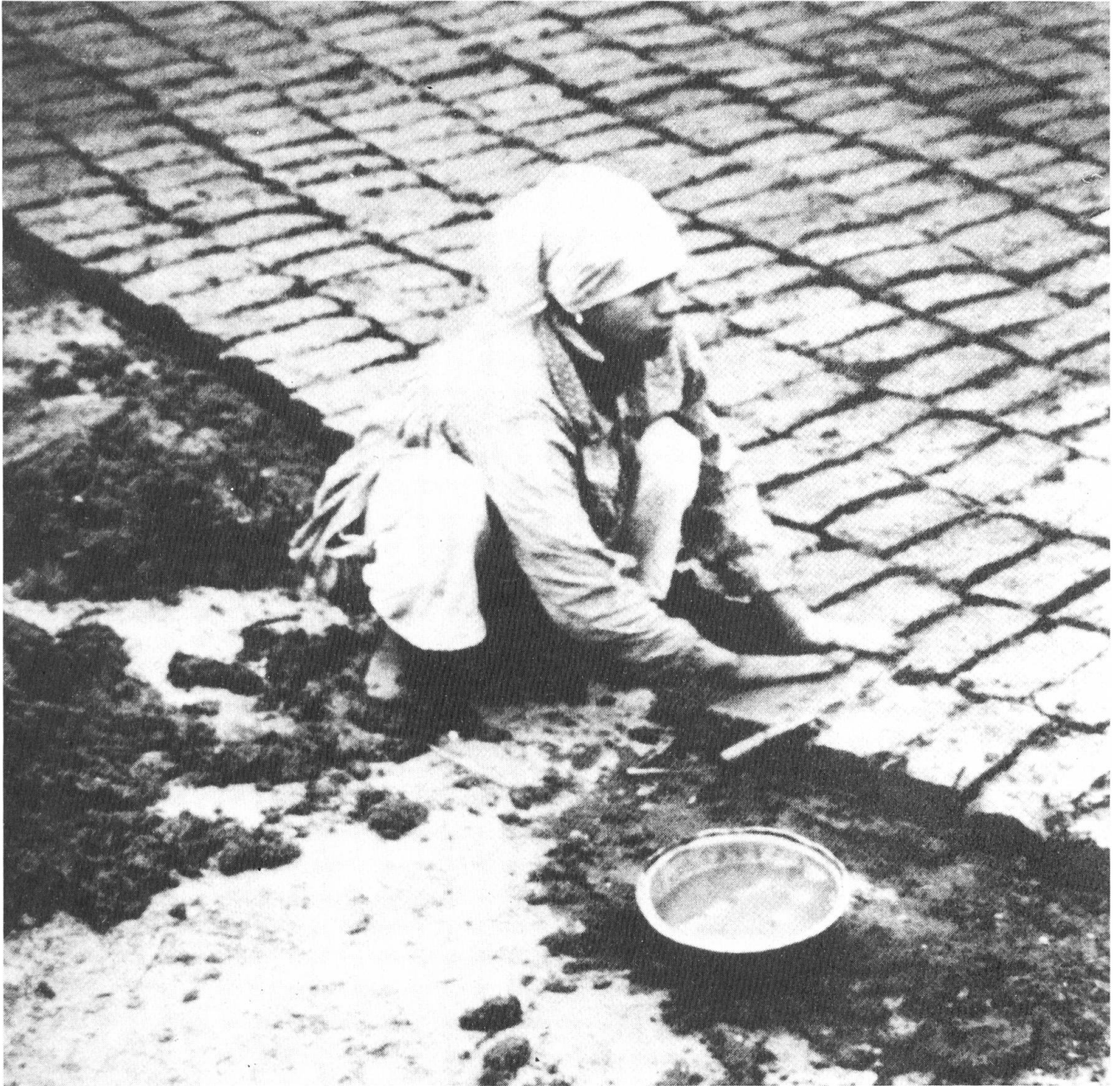
Herstellung der sonnengetrockneten Ziegel, wobei kleingeschnittenes Stroh dem Nilschlamm als Bindemittel beigemischt wird.