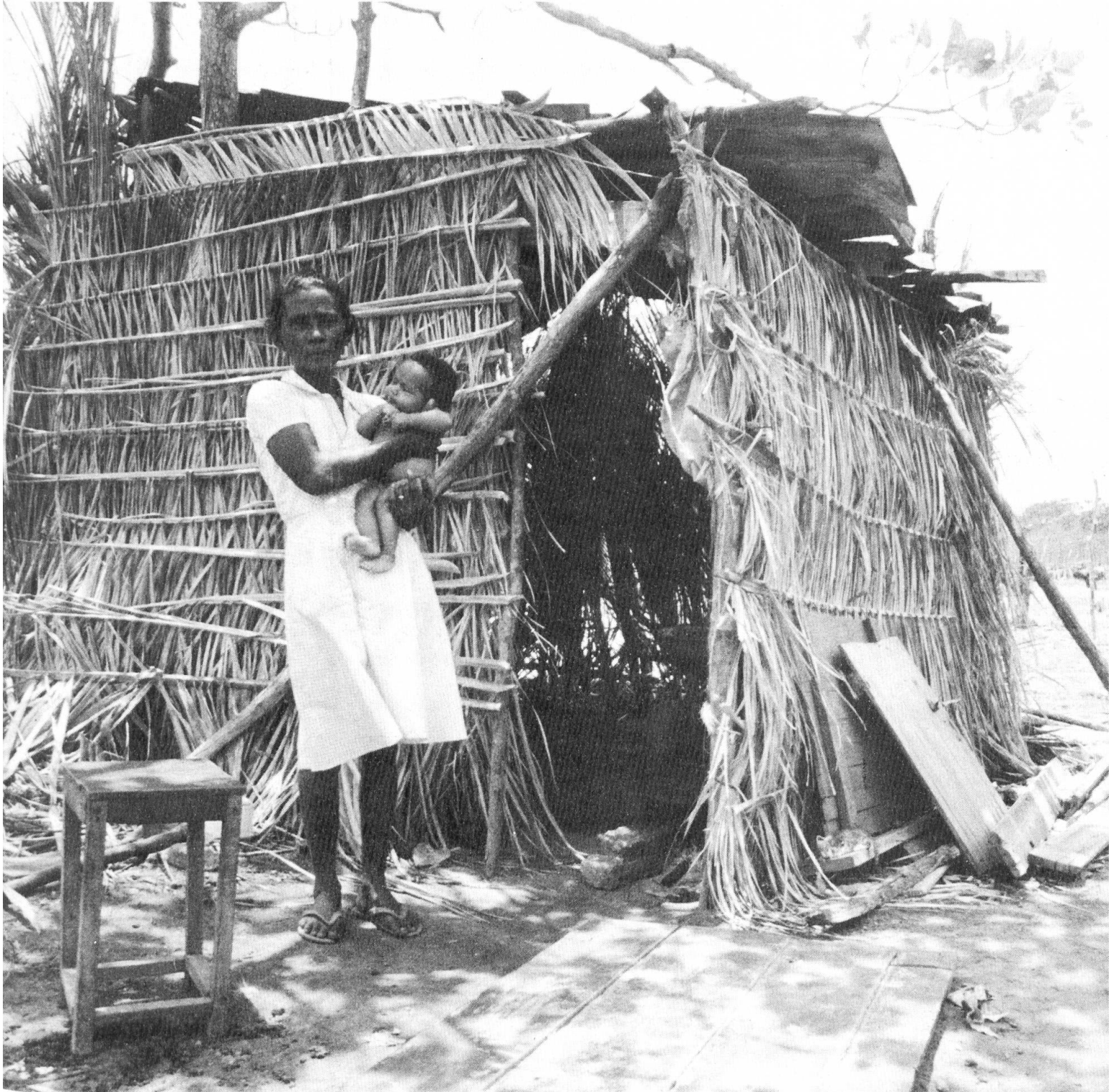
«Gott ist ein Gott der Armen und Hilflosen.»