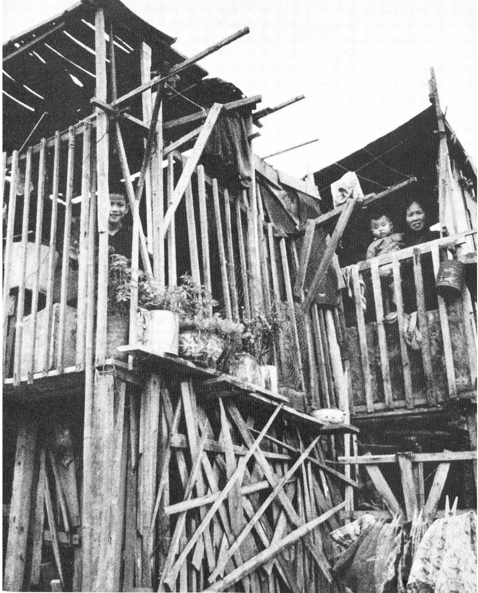
«Gott will, dass alle in Freiheit und gerechtem Wohlstand leben.»