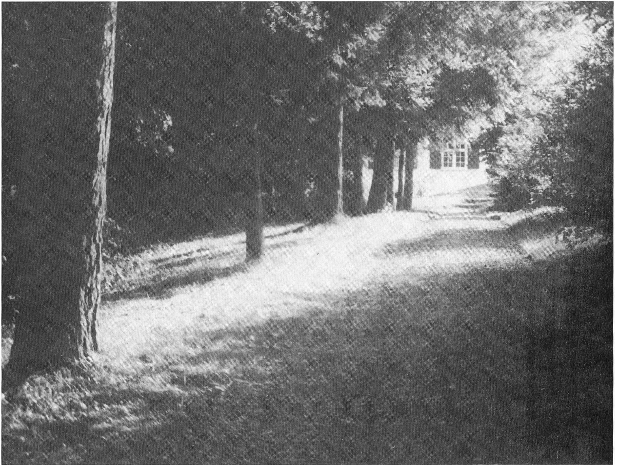
Ausschnitt aus dem Park, den die Gäste des Hauses der Stille benutzen können.