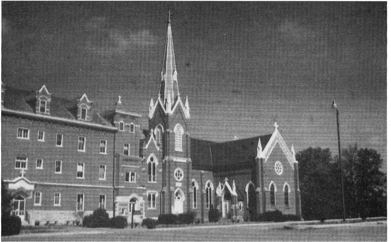
Das Kloster Maria Stein in Ohio, USA.