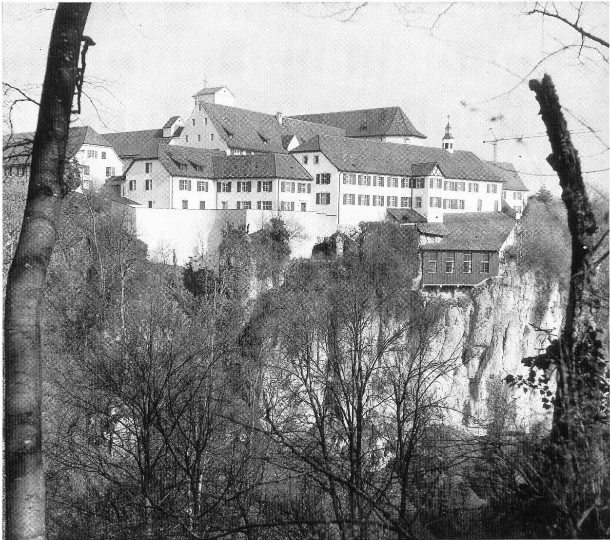
Klosteranlage Mariastein von Osten . Neurestaurierter Glutzbau, im Süden der Wirtschaftstrakt mit Gästespeisesaal und am Felsen angehängt der Laubengang des neuen Gnadenkappelleneingangs.