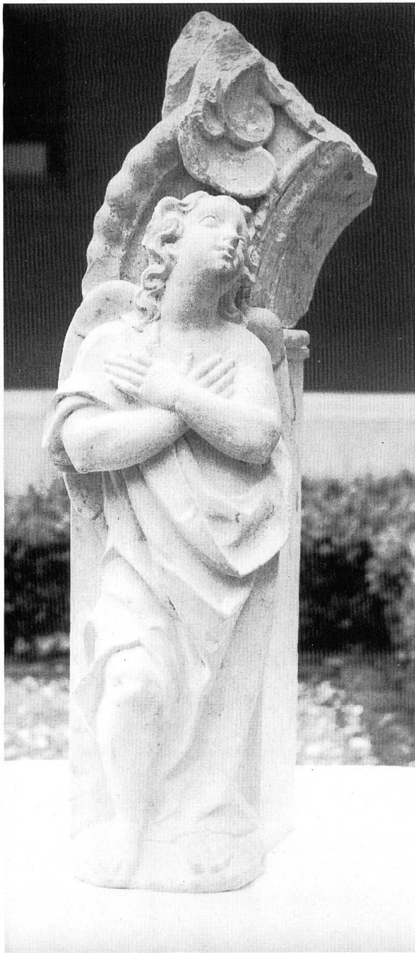
Gnadenkapelle, Tabernakelengel. Zwei Anbetungselengel standen auf früheren Fotos des Schwalleraltares auf dem Tabernakel. Nachdem sie dort «im Wege» waren, wanderten sie auf den Estrich der St.-Josefs-Kapelle. Der Ansatz zum Bogen wurde als Spolie mit anderen Teilen aus den Fensteraufmauerungen im Kapellengang herausgenommen.