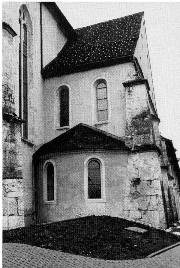
Die erneuerte gerundete Apsis des nördlichen Seitenschiffes.

Nicht alle Beter, die in der Josefskapelle gebetet hatten, waren damit restlos einverstanden. Manch einer vermisste jetzt das grosse einprägsame Kruzifix, das an der geraden Chorwand angebracht war. Wir werden auch solche Wünsche berücksichtigen müssen. Möglichkeit dafür besteht.