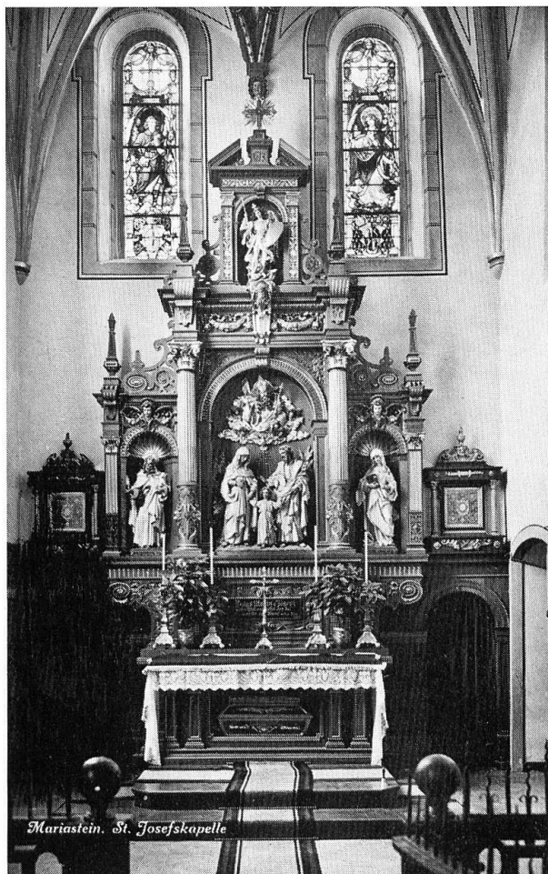
Die Josefskapelle vor der Restaurierung 1973/74.

der Anbetung der Hirten und ist umrahmt von einem reichen Frucht- und Blumenband. Sechs anmutige Putten tragen die Zimmermannswerkzeuge des Nährvaters Joseph. Das obere Medaillon stellt die Flucht nach Ägypten dar. Das untere Bild zeigt Josephs Tod. Der Heilige liegt auf einem Ruhebett, ihm zur Seite der segnende Heiland. Auf der andern Seite des Bettes sitzt Maria mit dem geöffneten Psalmenbuch. Lebensgrosse Engel flankieren das Hauptrelief und weisen auf das zentrale Weihnachtsgeheimnis hin.