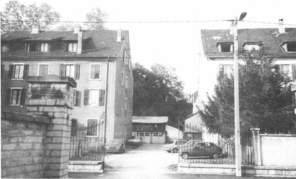
Delle heute: Zwischen diesen Häusern stand einst die Kirche.

der Dominikanerinnen in Delle, die 1876 hierher gekommen waren und ebenfalls 1901 wegziehen mussten, nach dem Verkauf profaniert wurde, d. h. als Cinéma und Tanzsaal benutzt wurde. Zudem war nach dem Urteil des Architekten Jauch die Kirche der Benediktiner offenbar in schlechtem baulichen Zustand.