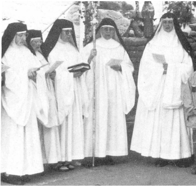
Vesper mit den Zisterzienserinnen (Bischof Nowak und Äbtissin Assumpta von Seligenthal bei Landsbut).

«Speicher-Museum», Kinderspielprogramm und Mittagessen aus den Gulaschtöpfen der Feuerwehr Eisleben.