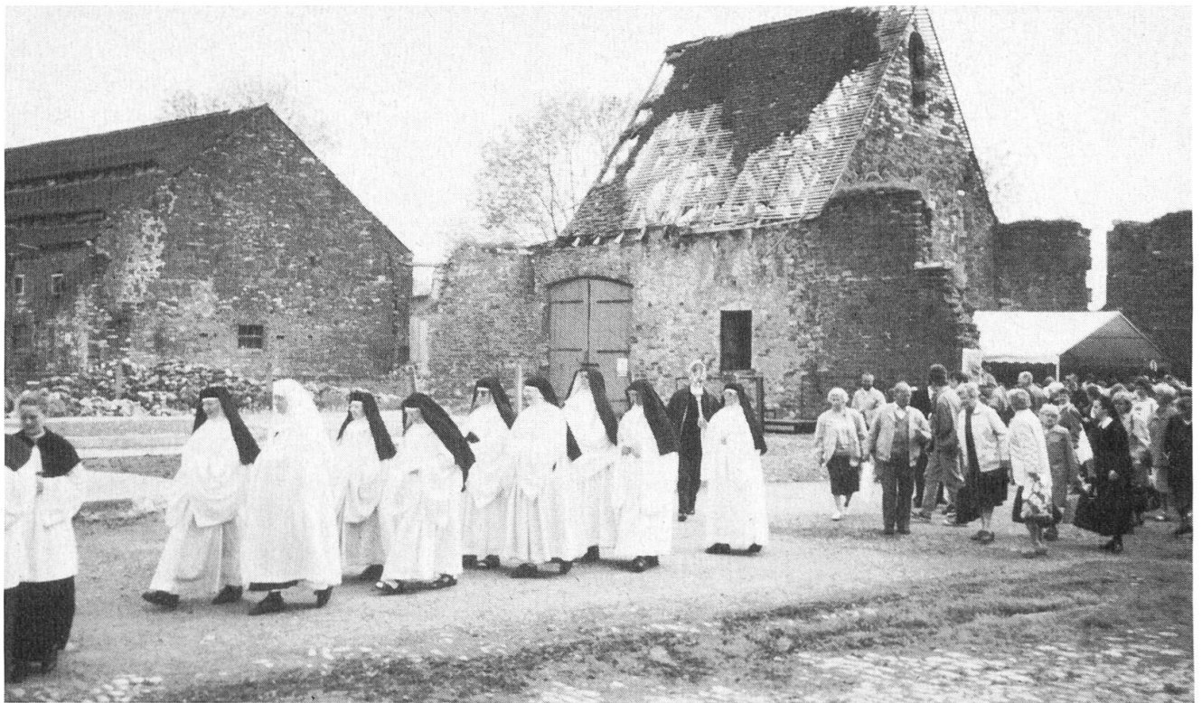
Auszug nach der Vesper, im Hintergrund die Ruine der Klosterkirche von Helfta.