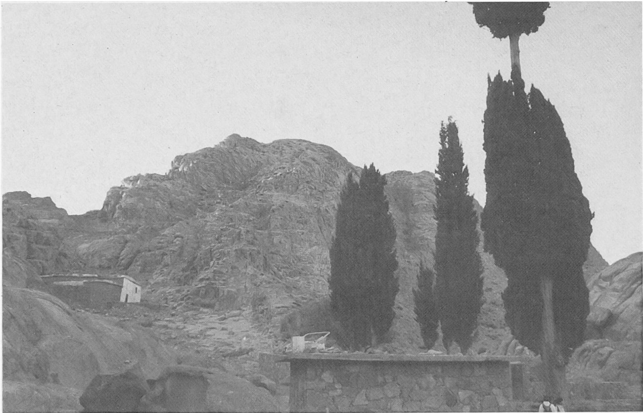
Farsch Elija, dahinter der Gipfel des Moseberges. Nach der Tradition begegnete Elija hier dem Herrn in Säuseln (1 Kön 19, 11 ff.).