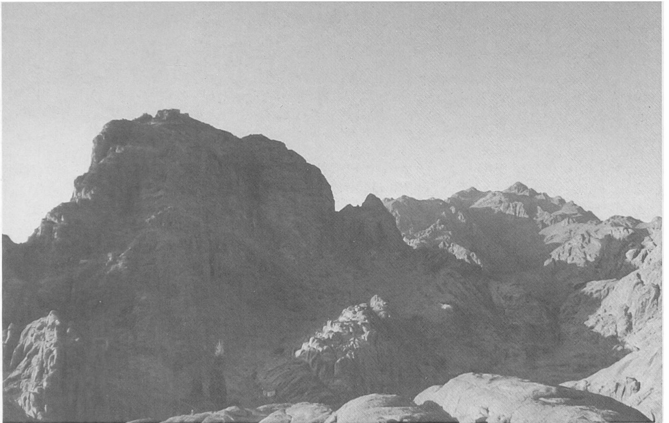
Der Gipfel des Moseberges (links); rechts im Hintergrund die Spitze des Katharinenberges. Er ist mit 2642 m ü. M. der höchste Gipfel auf dem Sinai.

Stunde schweigend zu gehen. So konnten die Guides nicht bei jedem Oasengärtchen stoppen und wieder einen Vortrag halten. Durch das Nakeb-el-Haua zogen wir zu einem Pass hoch, von dem man einen schönen Ausblick auf die heilsgeschichtlichen Orte des Sinai-Ereignisses hatte (vorausgesetzt natürlich immer, man hält den Dschébel Musa, den Moseberg, beim Katharinenkloster für den «richtigen» Berg Sinai). Wir wanderten durch ein Beduinendorf des Stammes der Dschibelía in die Er-Racha-Ebene hinein, in die sog. «Ebene der Vorbereitung», wo die Israeliten gelagert haben sollen, während Mose den Berg hoch- und runterstieg. Zwar nicht am Horeb-Massiv mit dem Moseberg, aber an einem anderen Gebirgsklotz neben der Ebene hing eine dicke, dunkle Gewitterwolke, aus der es bedrohlich donnerte. Man brauchte die Bibel gar nicht aufzuschlagen, alles schien so genau zur Gotteserscheinung auf dem Berg Sinai in Ex 19 zu passen: «Es begann zu donnern und zu blitzen. Schwere Wolken lagen über dem Berg, und