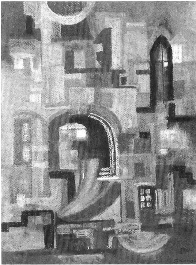
Höhle und Schlüssel